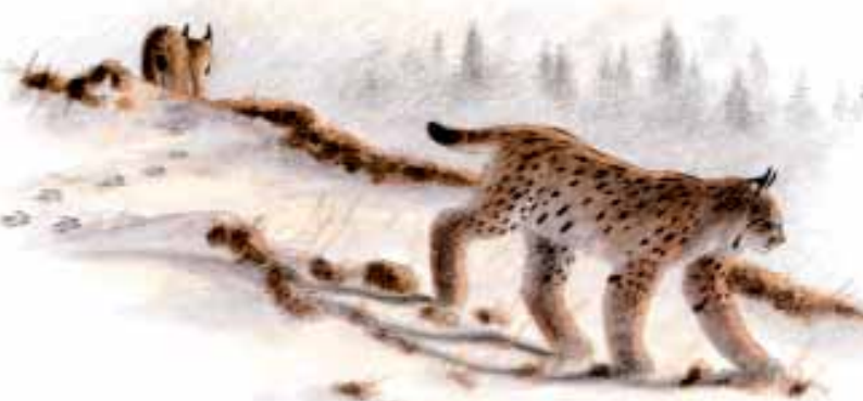
Lynx dans la neige du jura. Illustration Jacques Rime.