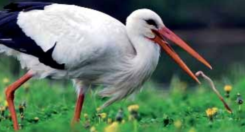
Cigogne blanche à la chasse aux lombrics.