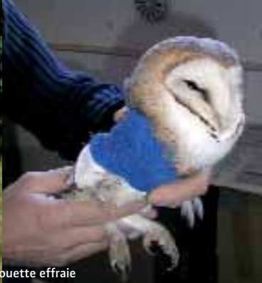
Relâcher de Bondré et soins d'une chouette effraie